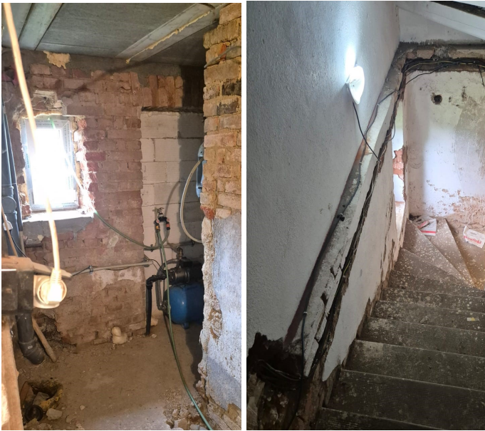
Fotodokumentace od znalce posudku ze dne 29.09.2024: